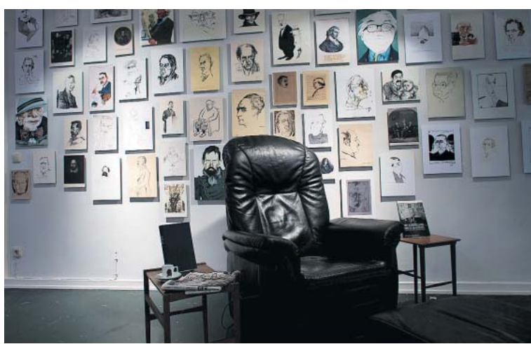
Sein Platz bleibt leer: Marcel Reich-Ranickis Lesesessel