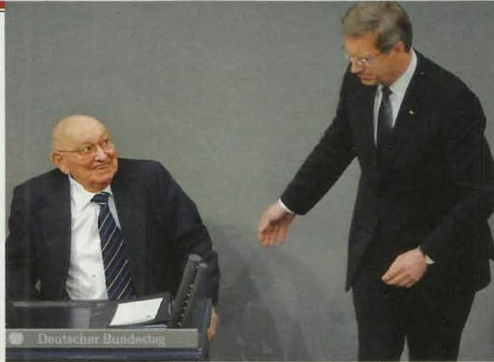
Treffen im Bundestag Wulff müsse zurücktreten, sagt Reich-Ranicki. „Er hat zu hohe finanzielle Ansprüche“

Irgendwann bei Göttingen holt der Sohn eine leere Ringbuchmappe aus dem Koffer, die seine Frau noch kurz